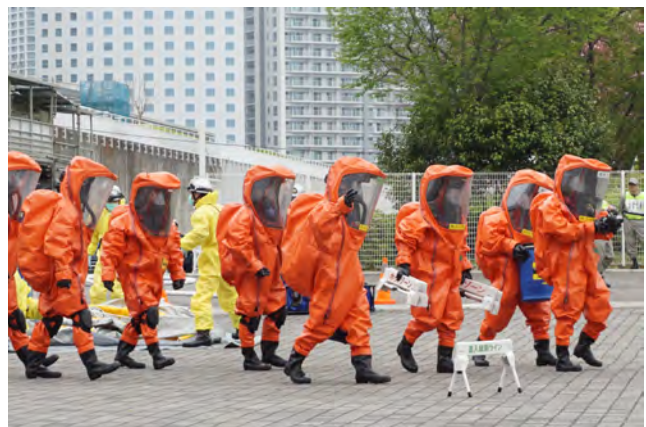
テロ対策訓練(神奈川県警)