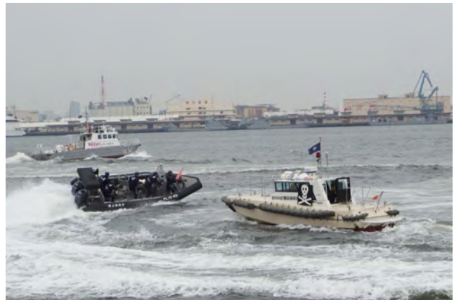
テロ対策訓練(海上保安庁)