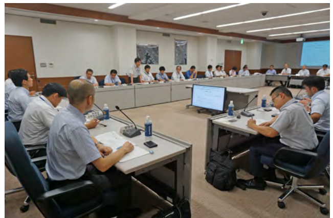
警戒本部準備会議