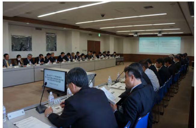
横浜市開催推進本部会議の様子