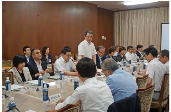
本部長の挨拶の様子